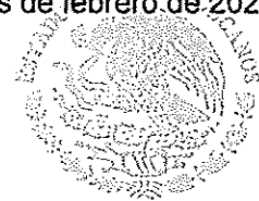
DIP. OLIVER LÓPEZ GARCÍA

Dado en el salón de sesiones del Congreso del Estado Libre y Soberano de Oaxaca, en San Raymundo Jalpan, Distrito del Centro, Oaxaca, a los 05 días del mes de febrero de 2026.