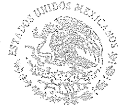
DIP. OLIVER LÓPEZ GARCÍA PRESIDENTE

GOBIERNO CONSTITUCIONAL DEL ESTADO DE OAXACA PODER LEGISLATIVO LXVI LEGISLATURA