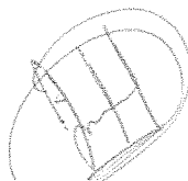
DIP. EVA DIEGO CRUZ PRESIDENTA.

DADO EN EL SALÓN DE SESIONES DEL H. CONGRESO DEL ESTADO. - San Raymundo Jalpan, Centro, Oaxaca a 07 de abril de 2026.