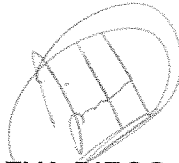
DIP. EVA DIEGO CRUZ PRESIDENTA.

DADO EN EL SALÓN DE SESIONES DEL H. CONGRESO DEL ESTADO. – San Raymundo Jalpan, Centro, Oaxaca a 07 de abril de 2026.