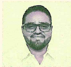
DIP. OLIVER LÓPEZ GARCÍA PRESIDENTE

De acuerdo con el artículo 29 del Reglamento Interior del Congreso del Estado de Oaxaca, toda Comisión se compondrá de cinco diputados de acuerdo a la propuesta aprobada por el Pleno en fecha 19 de noviembre de 2024, de conformidad con lo dispuesto en la Ley.