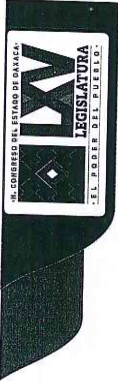
Cuentas de Ingresos Bases Mensuales para el Ejercicio Fiscal 2022