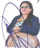
DIPUTADA ROSALINDA LÓPEZ GARCÍA INTEGRANTE