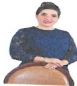
DIPUTADA ELVIA GABRIELA PÉREZ PRESIDENTA

De conformidad al acuerdo número 02 del índice de esta Sexagésima Quinta Legislatura, aprobado el 24 de noviembre de 2021, en el que se acuerda la integración de las Comisiones Permanentes, como órganos constituidos por el Pleno e integrados por cinco diputados o diputadas, que tienen a su cargo tareas de dictamen legislativo, de información, de control evaluatorio, de opinión y de investigación, contribuyendo a que el Congreso cumpla con sus atribuciones constitucionales y legales; en consecuencia la Comisión Permanente de Igualdad de Género, quedo integrada conforme el acuerdo de cita, de la siguiente forma: