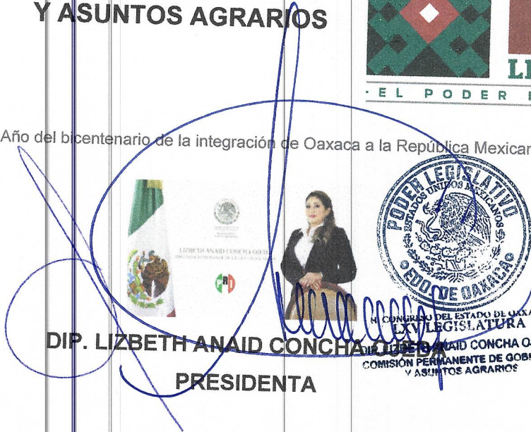
DIP. LIZBETH ANAÏD CONCHA OJEDA PRESIDENTA

"2024, Año del bicentenario de la integración de Oaxaca a la República Mexicana"