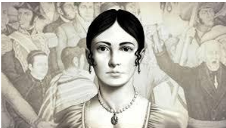
3Leona Vicario, mujer insurgente, miembro del grupo Los Guadalupe