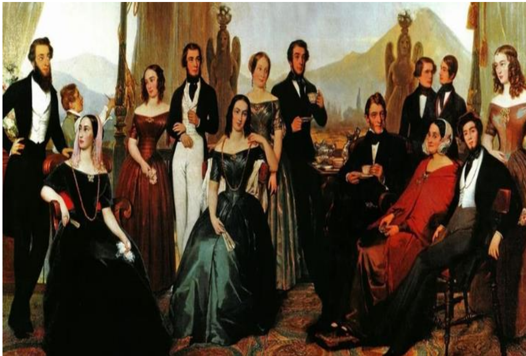
4 grupos de reuniones entre las clases aristócratas coloniales

Tras la aprensión del Cura Miguel Hidalgo, propuso a los demás simpatizantes arrestar al Virrey para así realizar un intercambio de rehenes, el virrey por los insurgentes detenidos. Más tarde sería traicionada por uno de sus amigos, siendo encarcelada hasta el año 1820.