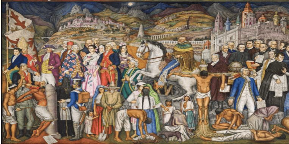
6 Retablo de la Independencia de México, obra de Juan O'Gorman

de la presencia de las mujeres que tuvieron participación dentro del movimiento, así mismo, aquellas que son representadas se ven opacadas en distintas formas.