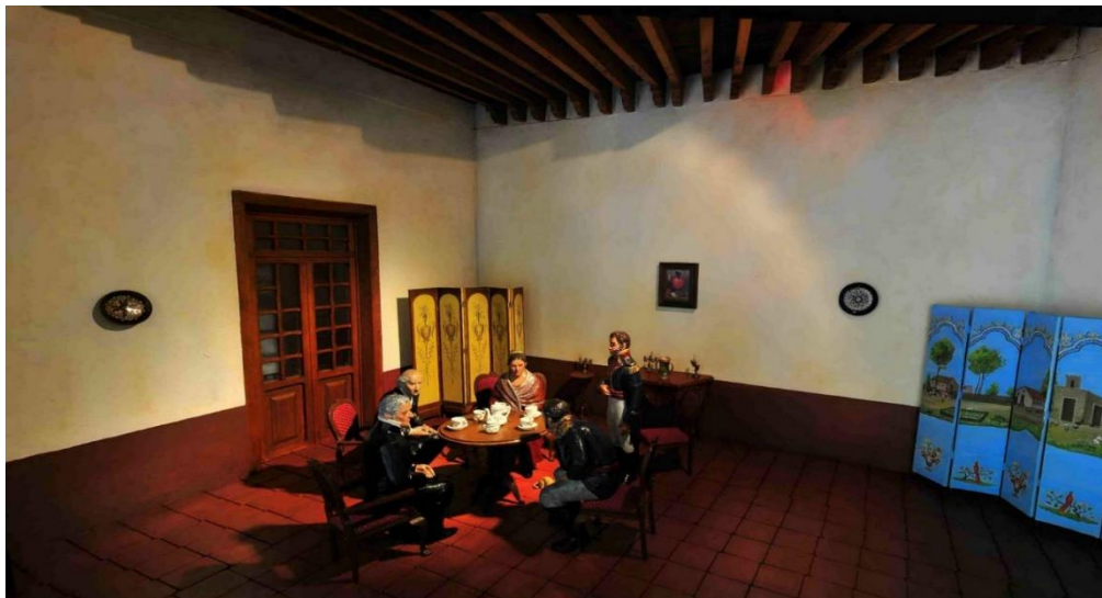
2 Conspiración en una tertulia literaria en Querétaro: entre poesía, letras e ideales

Si bien la conspiración de Querétaro estaba integrada por un gran número de hombres, es innegable destacar la participación política que tuvo Josefa Ortiz Téllez fue de suma importancia para llevar a cabo los planes, su influencia política permitió por gran tiempo mantener al grupo conspirador informado acerca de los movimientos y decisiones que se llevaban a cabo dentro de las instituciones virreinales influyendo en gran medida en el actuar de los involucrados para iniciar el movimiento independentista.