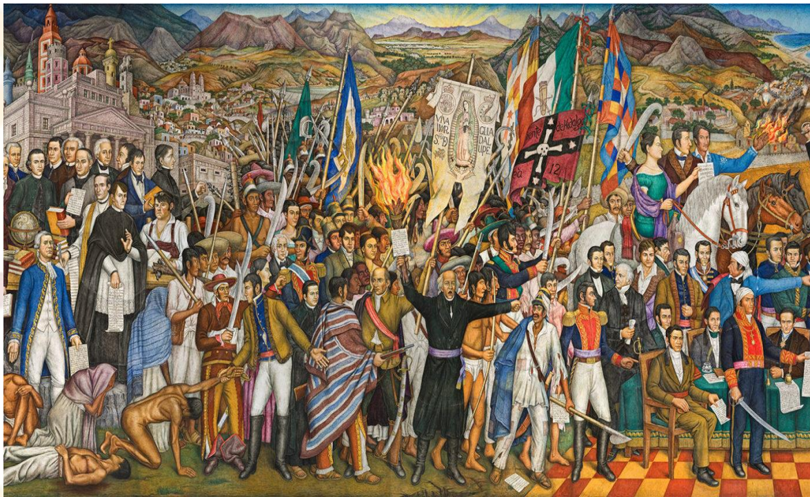
5 Retablo de la Independencia de México, obra de Juan O'Gorman